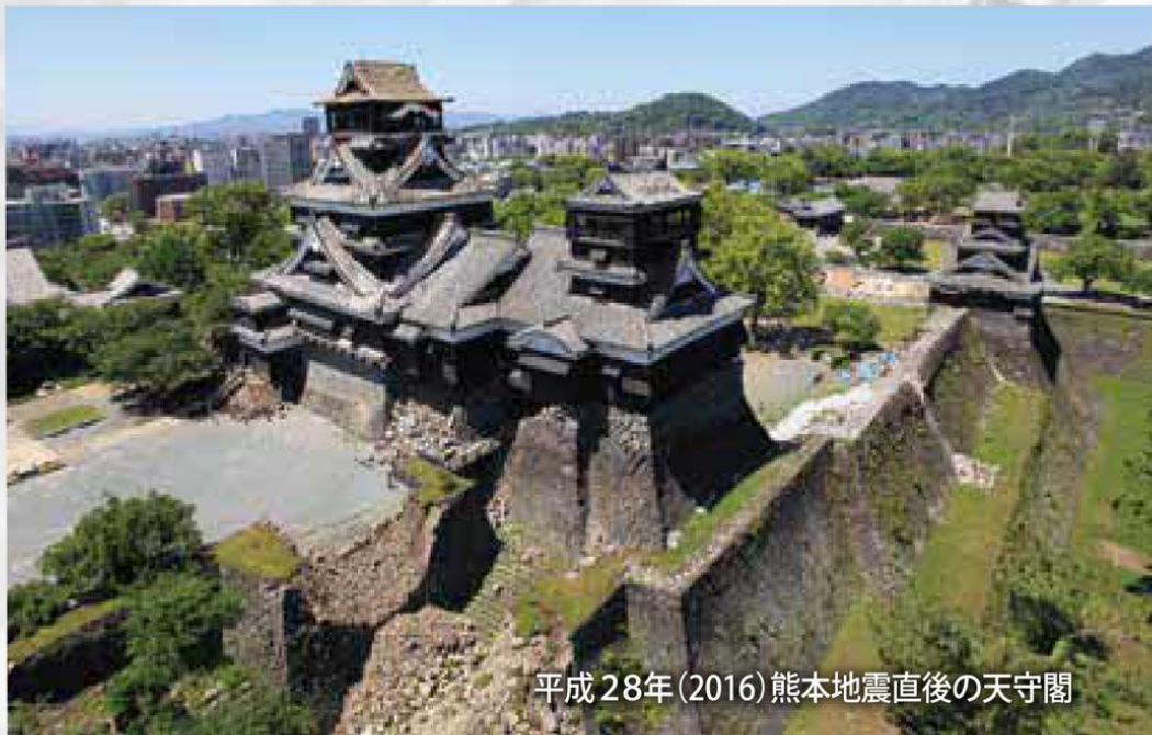
平成 28年(2016) 熊本地震直後の天守閣

熊本城は加藤清正によって関ヶ原の戦いの前には現在の位置に築城され始め、本丸は慶長12年(1607)に完成しました。周囲5.3kmに及ぶ広大な城郭で、往時は櫓49、櫓門18、城門29があったといわれます。平成28年(2016)熊本地震では50ヵ所の石垣が崩落し、国指定重要文化財建造物13棟すべてが被災するなど、甚大な被害を受けました。現在、多くの支援を受けながら、復旧を進めています。