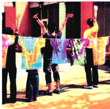
ダンスグループの舞台衣装を自分達で染めた！

自分で染められた！すごい！ 「すごいね」ってほめられた！うれしい！ 着てみたら似合う！ やったね！