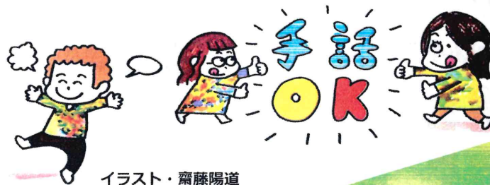
イラスト・齋藤陽道

わたしたち シピニ sipiniは 埼玉、東京、熊本を拠点に 全国各地で、ものづくりの 大切さと楽しさを 伝える活動をしています。