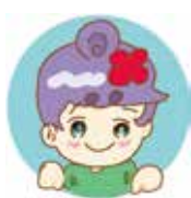
地活キャラクター 希望(のぞみ)ちゃん

〒862-0971 熊本市中央区大江5丁目1番15号 TEL 096-371-8886(直通) FAX 096-364-5309 メール kibousou@bz01.plala.or.jp ホームページ https://kibousou.com/